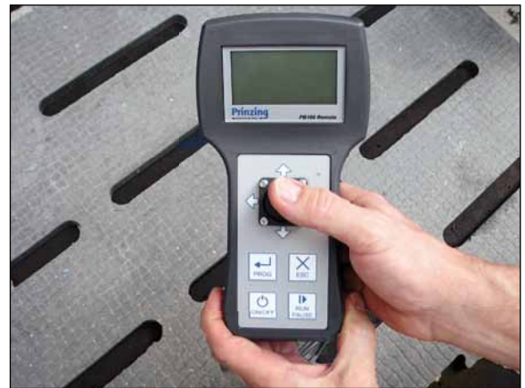
Handbedienteil zur Einstellung der Parameter und zum manuellen Fahren des PriBot.