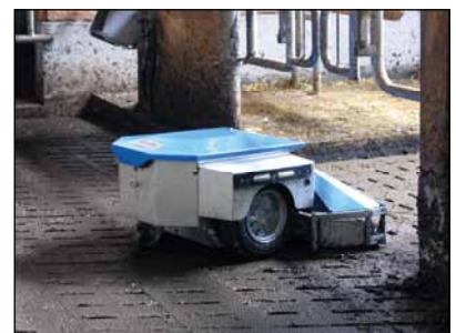
... zuverlässig an Ecken und um Ecken herum.