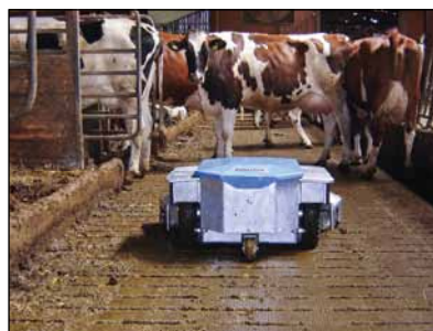
... in schmalen Übergängen und Laufgangbereichen.