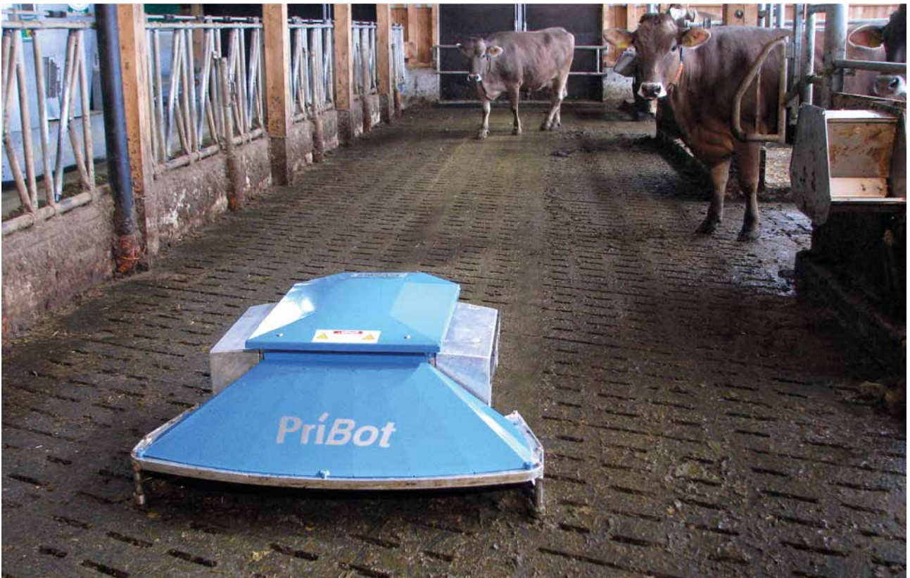
Der PriBot räumt den Spaltenboden in freier Fahrt ...

Saubere Spaltenböden verbessern die Stallhygiene und sorgen damit für saubere und gesunde Tiere!