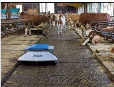
... entlang der Aufkantung an Liegeflächen.