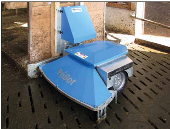
PriBot an der Ladestation

Kompakt · Wendig · Gründlich · Robust · Zuverlässig